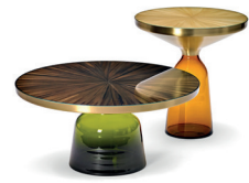
Olivgrün olive green Bernsteinorange amber orange Strohmarketerie straw marquetry Mokkabraun mocha brown Gold