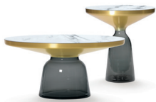
Quarzgrau quartz grey Marmor marble Bianco Carrara

Pied en verre de différentes couleurs soufflé à la bouche. Embout en forme d'entonnoir en laiton massif verni clair ou en acier massif bruni noir verni clair. Plateau de table en verre de cristal laqué en noir ou plateau de table en marbre en différentes versions, poli et imprégné. Ou plateau de table avec marqueterie de paille enchâssée dans le verre en différentes versions.